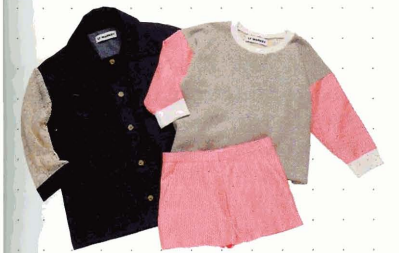
左から時計回りに ジャケット¥45,150、スウェット¥15,750、ショートパンツ¥25,200

Info. サンスマイル 03-6672-6480 www.ladybird-tokyo.com