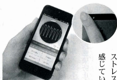
指をあて、測定する様子

医療機器の販売などを手掛けるアトランティック（名古屋市、是久高慶社長）と、ソフトウエア開発を手掛けるDUMSCO社（本社東京）、バイオコム・テクノロジ社との日本でのビジネスを代表するAtlantic Trading Pacific（サンフランシスコ）は、三社協業プロジェクトとして、日本で初めてストレスが測れるiPhone専用アプリ「ケーション」ストレススキャン」をリリースした。 同社は一九九三年に設立。多数のクリニックやアンチエイジングの専門家と提携し、常に新しい美容治療、処方などを研究して、商品開発、ユーザーへのアドバイスを行っている。 「ストレススキャン」は、心拍解析と自律神経研究の最先端をリードし続けている、米国バイオコム・テクノロジ社から技術提供を